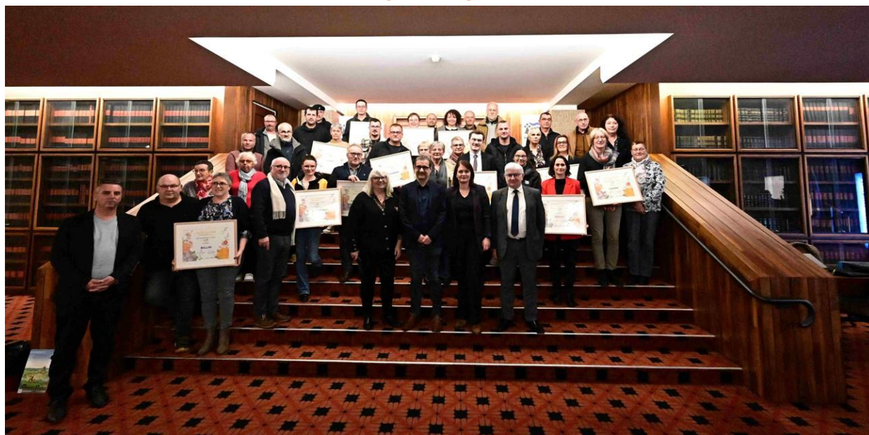
Remise des prix communes labellisées 2024 - Villes et Villages Fleuris - Hôtel du département - Vannes

Dans un contexte de multiples défis face au changement climatique, les communes s'engagent résolument dans la transition écologique. Le label « Villes et Villages Fleuris » est placé sous le signe de la qualité de vie, de la préservation de la biodiversité et de la gestion durable des espaces publics. Ouvert à toutes les communes et constitue un levier puissant pour traduire concrètement, sur le terrain, les enjeux des transitions environnementales : gestion différenciée des espaces publics et préservation de la biodiversité, gestion économe de l'eau et des ressources, mobilisation des publics pour l'abandon de l'usage des pesticides.