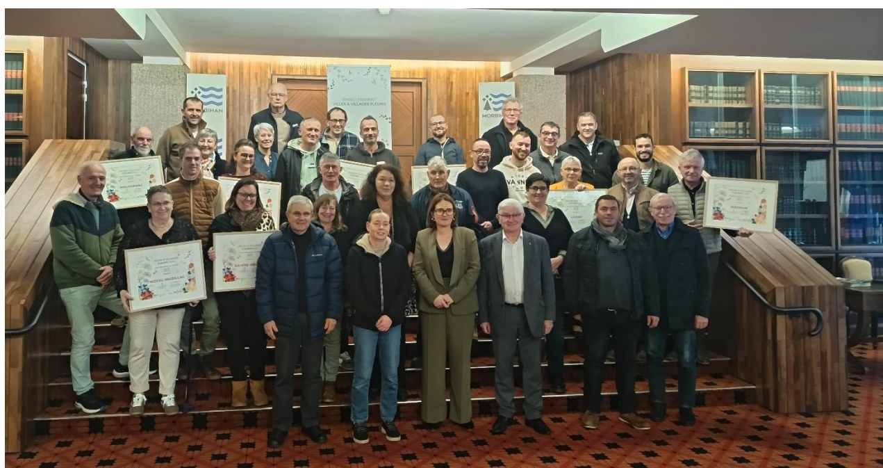
Remise des prix communes labellisées 2025 - Villes et Villages Fleuris - Hôtel du département - Vannes

À l'heure où les territoires doivent concilier attractivité, bien-être des habitants et adaptation au changement climatique, le label « Villes et Villages Fleuris » s'impose comme un repère. Il valorise les communes qui s'engagent à aménager durablement leurs espaces, en intégrant davantage de végétation, en préservant l'équilibre entre zones urbaines et naturelles, et en créant un cadre de vie agréable pour tous.