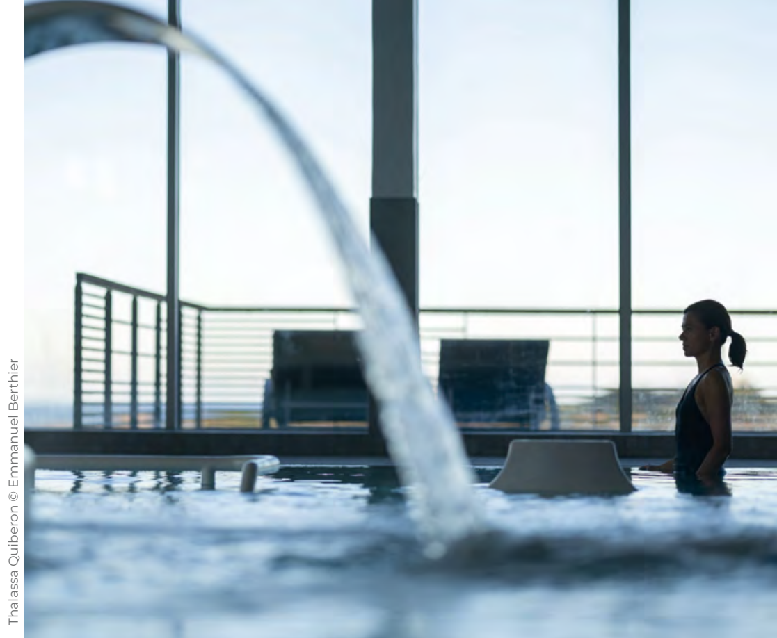
Thalassa Quiberon

Le soin Signature LB Facialiste nous bluffe par son effet bonne mine. Une gestuelle dynamique exerce un massage en profondeur sur la musculature du visage. Contours redessinés, pommettes rehaussées, regard pétillant, ce coup de frais donne envie d'aller de l'avant.