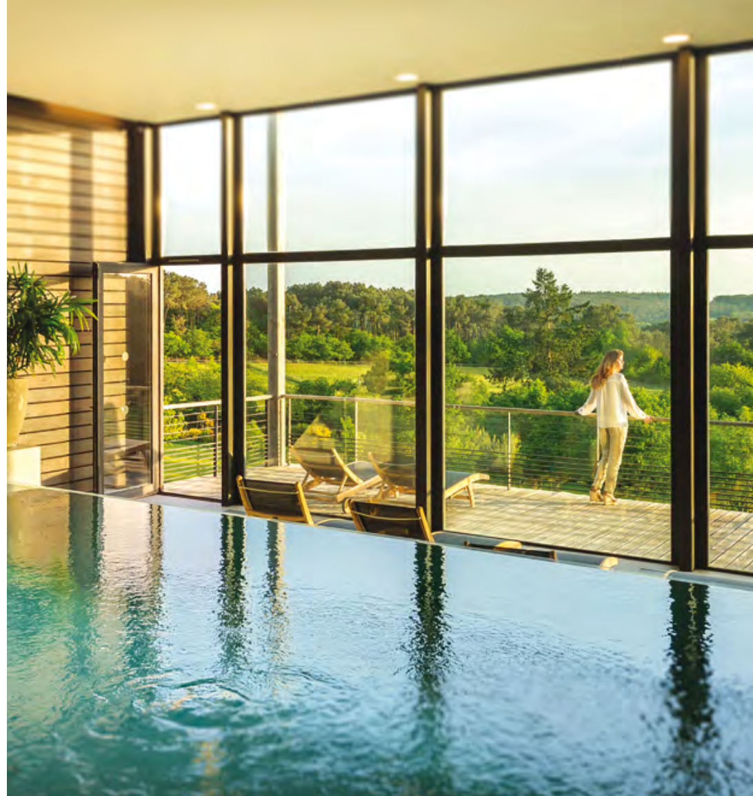
La Grée des Landes